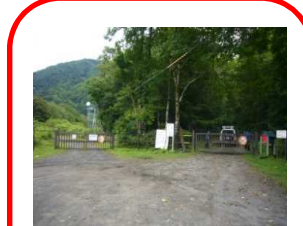
③『奥新冠発電所ゲート』幌尻岳へは右のゲートへ。車両通行止。ゲート前に駐車スペース有。入林届ポスト有(標高450m)