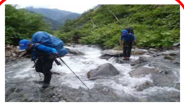
『尾根取り付き地点』幌尻沢を渡り、尾根に取り付く。(標高960)

林道を徒歩で歩く ③奥新冠発電所ゲートから ④新冠ポロシリ山荘 約19Km (徒歩で約5時間50分)林道を長時間歩く必要があります。途中は崖崩れや落石に注意しましょう。