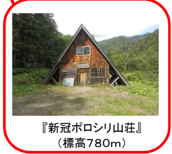
『新冠ポロシリ山荘』(標高780m)

林道を車両で通行 ②新冠ダムから③奥新冠発電所ゲートまで 約16Km (車で約40分) ①からと同様、未舗装道路が続きます。新冠湖畔を通る道路です。カーブではスピードの出し過ぎに注意しましょう。また、もしもの場合に備えて全席でシートベルトを着装しましょう。